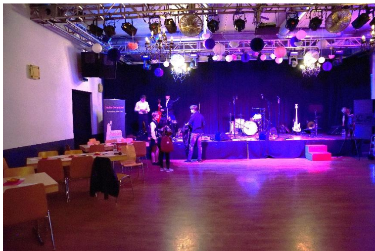
Saal Tische linke Seite

Im Saal gibt es zudem die Stehtische mit Barhockern. Es wird versucht, die Plätze nach Eingang der Bestellung zu verteilen. Die ersten Plätze vorne mit besserer Sicht, die letzten, die bestellen, im hinteren Teil. Es kann sein, dass an Ihrem Tisch auch andere fremde Leute zusätzlich platziert werden.