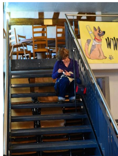
Treppenaufgang Saal zur Galerie